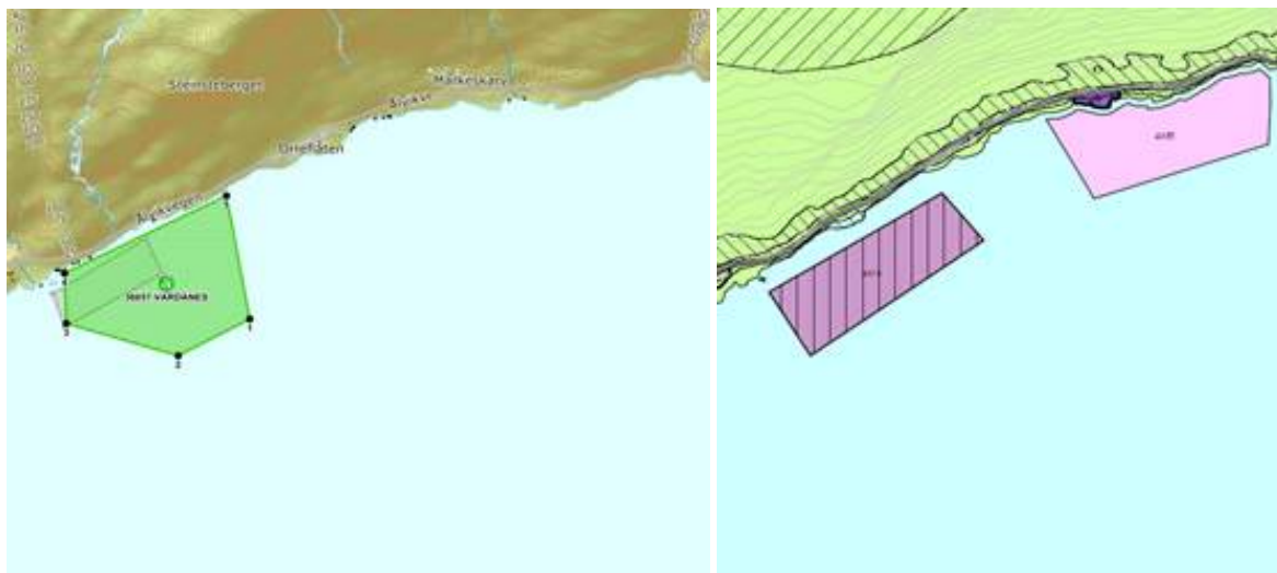
Figur 2. Til venstre, godkjent areal etter akvakulturlova, til høyre framlegg til AK-område.

Ved Vardanes er det gjeve akvakulturøyve til dyrking av tare innanfor areal avsett til akvakultur i gjeldande plan. I planframlegget er akvakulturområdet redusert slik at delar av anlegget vert liggjande utanfor AK-område. For dette området må Ak-område justerast, og som eit minimum må godkjent anlegg liggje innafor område sett av til akvakultur.