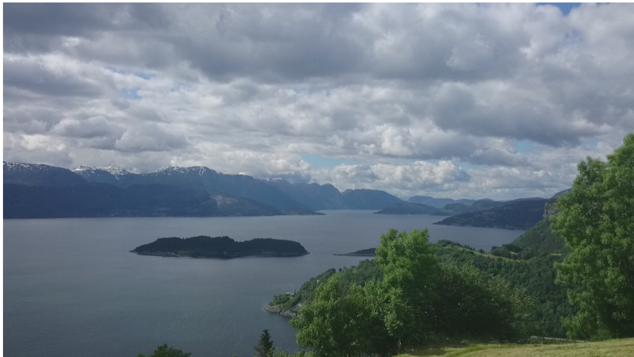
Foto av Kvamsøy, Tjuvholmen og Bjelkanes sett i frå Fykse på veg opp til Bjørkeveten

Fjorden og innseglinga i førhistorisk tid inn til Øystese og Norheimsund har vore eit sentral del av den førhistorisk bruken i regionen. Her er eit svært stort tal automatisk freda kulturminne og her går og skiljet mellom ytre og indre Samlafjorden. Fjorden er sentral i kulturlandskapet, der vetestadane Bjørkeveten i Kvam og Samlaveten i Jondal deler fjordlandskapet opp, men samstundes står i relasjon til vetane på Varaldsøy. Øystese og Herand har vore leidangsområde med kjende nausttuffer frå mellomalder. Det førhistoriske fjordlandskapet viser att i bronsealderøysene langs fjorden.