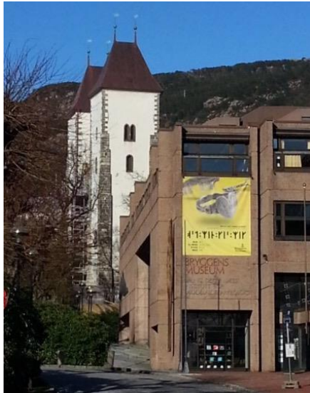
Fig. 1. Bryggens Museum, forside