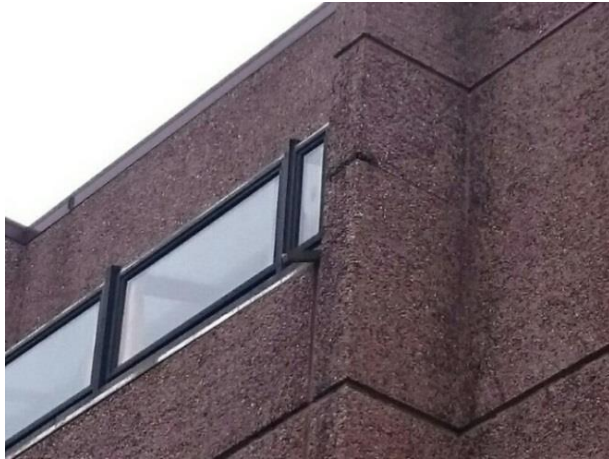
Fig. 4. Rust- og frostsprengning i fasaden administrasjon 3.etg.