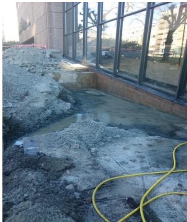
Fig 3. Vanninntrenging i grunnen

Fasaden har i flere år vist klare tegn til forvitring. Betongen skaller av og armeringsjern blir blottlagt. Rustsprenging og frostsprengning vil bare fortsette å akselerere disse skadene. Den sandblåste betongoverflaten har en særegen utforming og farge, og armeringsjernet ligger mange steder svært tett på den ytre overflaten - noe som i høy grad kompliserer utbedringsarbeider. Vi ser også en del riss i betongfasaden. Utbedringen av slike skader er omfattende og krever spesialkompetanse, som må kjøpes inn av eksterne eksperter på betongrehabilitering.