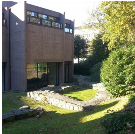
Fig 2. Bryggens Museum, bakside mot Mariakirken