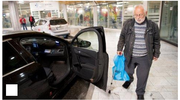
Sjåfør i Norgestaxi: - Ledelsen kan takke seg selv