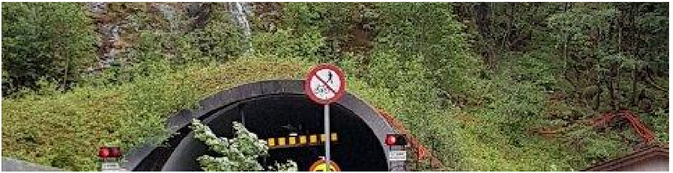
Stengt på grunn av ras: E39 åpner ikke i dag