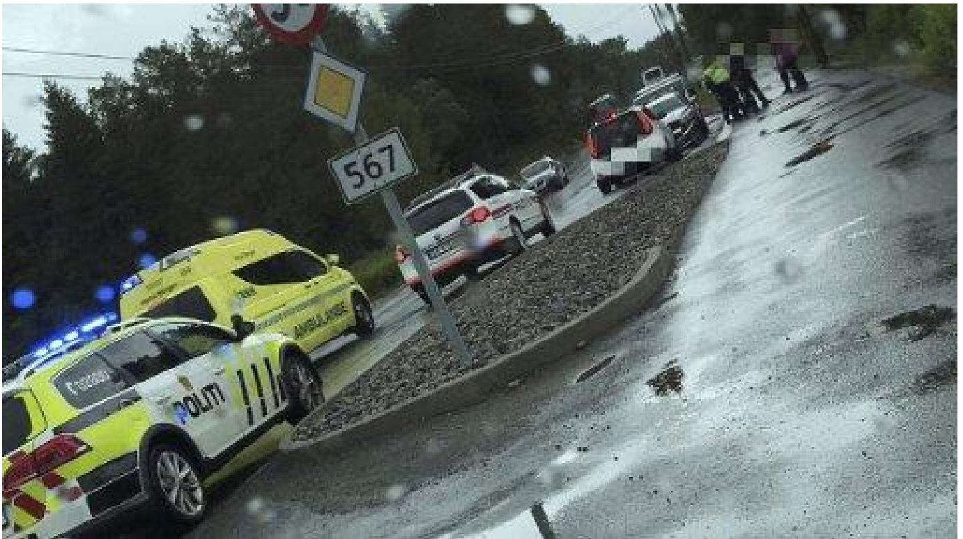
Trafikkulykke på E39