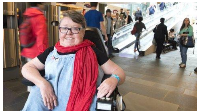
Siri slåss for livet, men nektes medisin