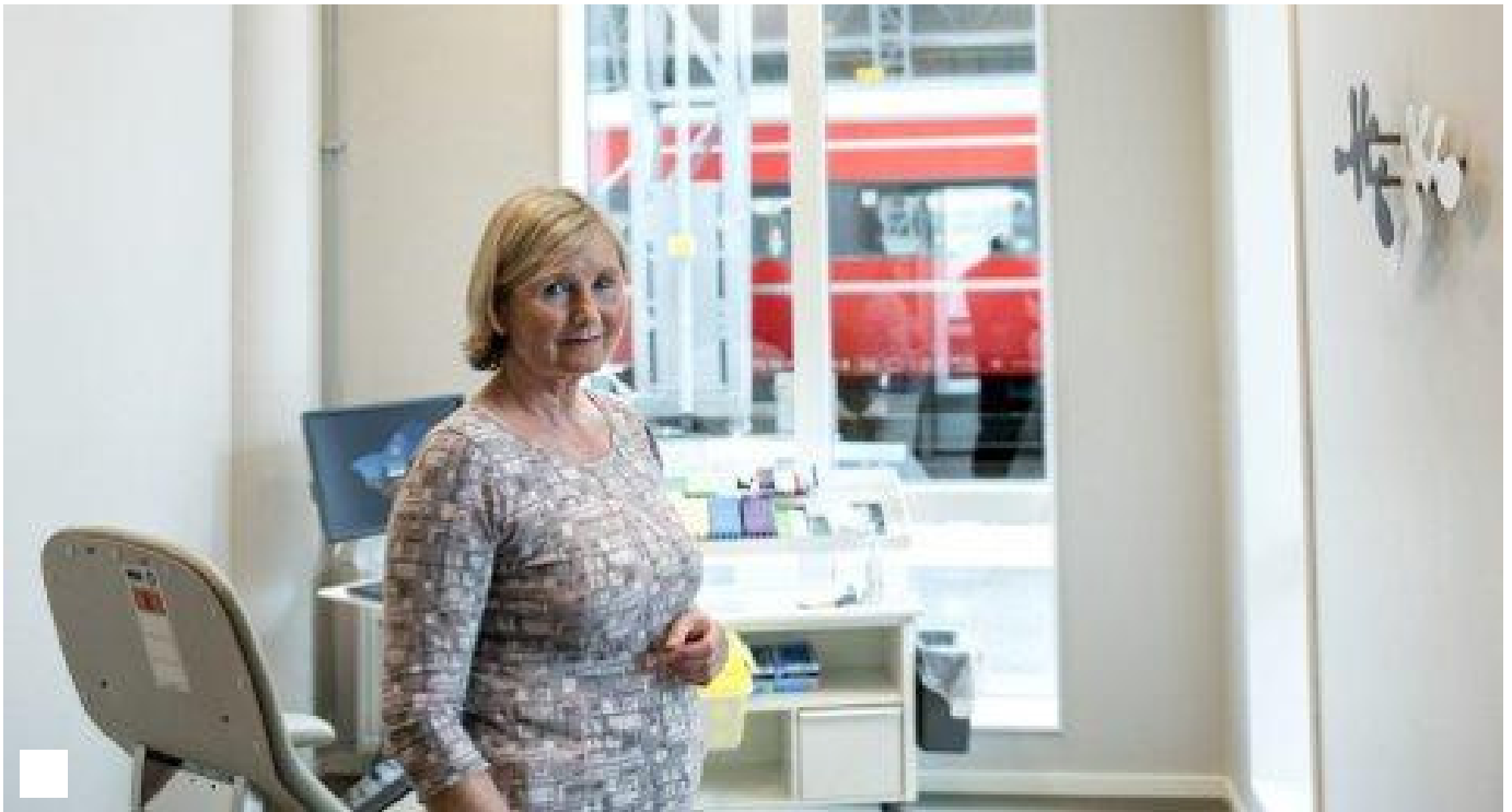
Ta blodprøven på stasjonen