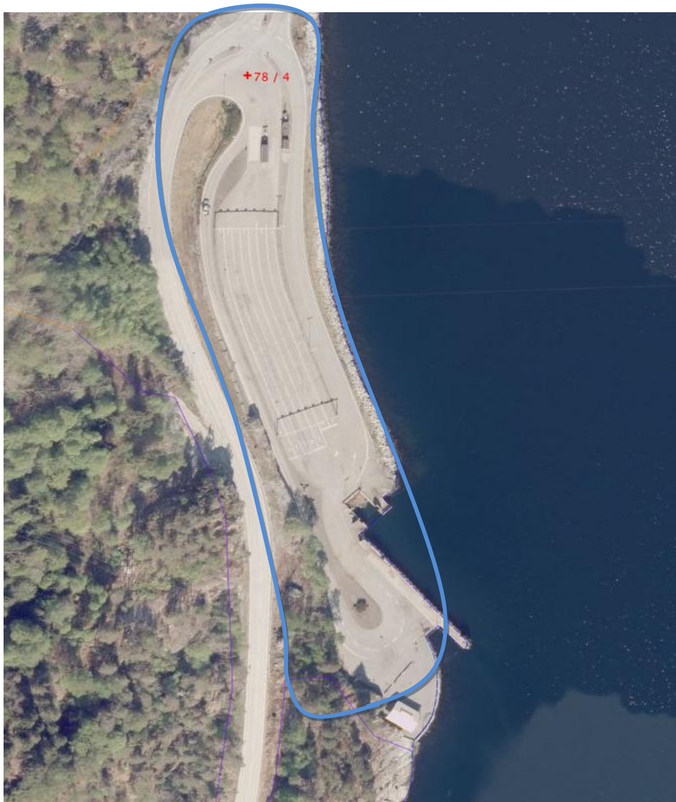
Figur 2. Viser flyfoto over området med skisse over aktuell leieområde .