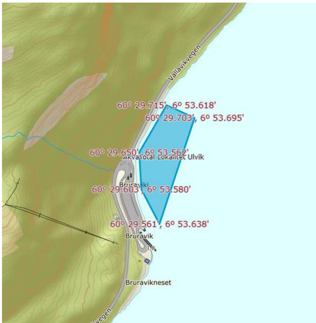
Figur 2. Viser kart over området med skisse over aktuelt sjøareal.