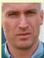
Erik Thorstvedt Fotballekspert i TV2, tidligere toppkeeper i bl.a. Tottenham