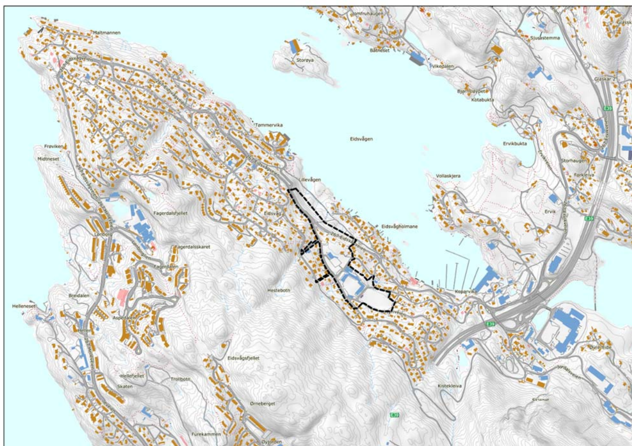
Figur 1. Kart som viser planområde til 1. gangs behandling.

I Norsk institutt for bioøkonomi (NIBIO) er området registrert som bebygd. Eidsvågskogen som ligger like ved er registrert som barskog med høg og særs høg bonitet (Figur 5).