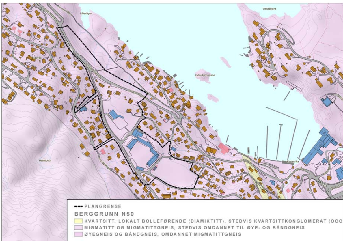
Figur 3: Berggrunnsgeologisk kart