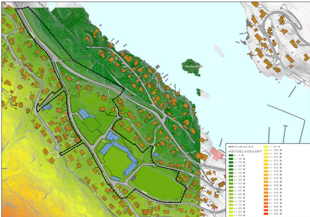
Figur 2: Kart som viser høydefordelingen i landskapet, i og rundt planområdet.