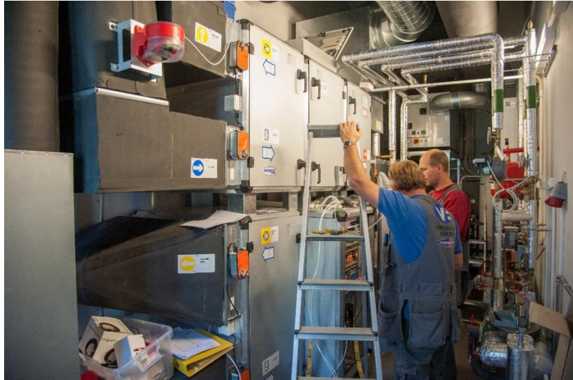
Teknisk rom under montering september 2013.