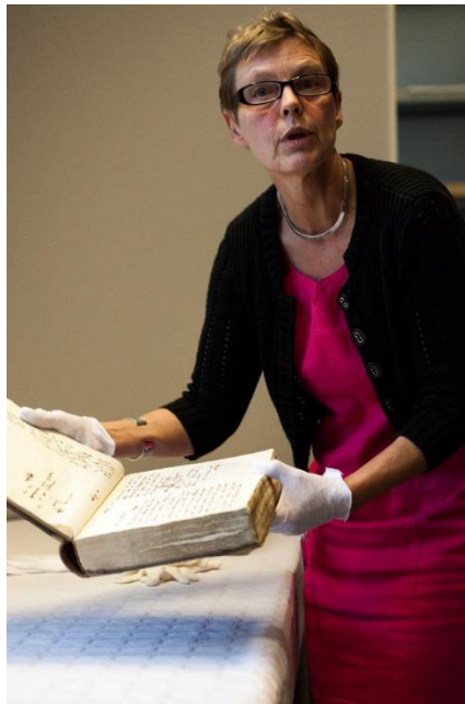
Opning av SINDARK i 2013. Kopibok frå Hovland Uldvarefabrik 1898.

Statlege arkivmidlar er og blitt fordelt på to sentrale institusjonar i prosjektperioden: Riksarkivet for søknader til arkivinstitusjonar, og Kulturrådet for musea. Her fell SINDARK mellom to stolar ved å verken vera etablert arkivinstitusjon eller museum. Vi meiner det burde vera felles handsaming av alle arkivsøknader, slik at det vert like vilkår for alle søkjarar.