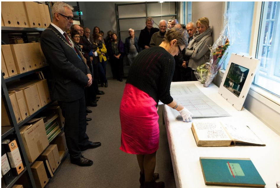
Frå ordningsrommet under opninga i 2013.

18.02.2014 vart det inngått avtale om SINDARK-prosjektet mellom Odda kommune og NVIM. Avtalen er lagt ved rapporten.