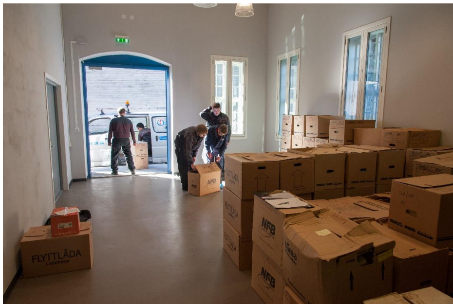
Smelteverksarkivet på veg inn i mottaksrommet i 2013.

Grovordning av smelteverksarkivet har pågått heilt til januar 2016, og alt materialet er no på plass i arkivmagasin. Det var viktig å få det vidare i systemet, for å frigje plass i mottaksrommet for nye mottak. Teikningsarkivet står framleis i mottaksrommet, då SINDARK ikkje har nok hyller for teikningar i magasin.