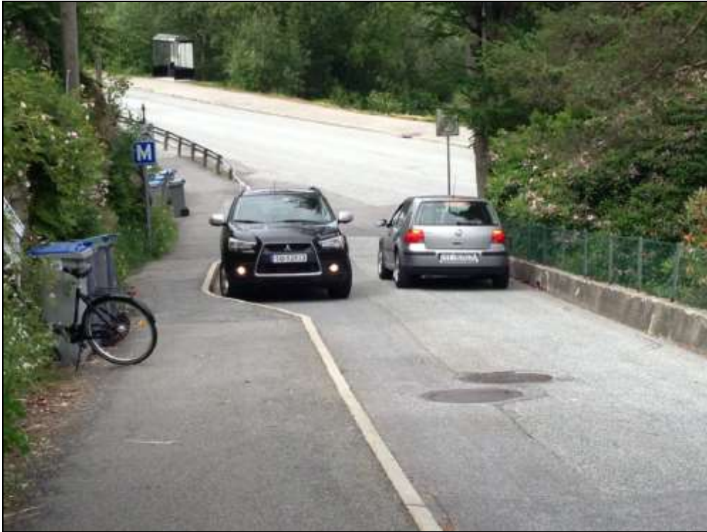
Figur 4. Eksisterende tilbud til gående langs Granlien.

I dag er tilbudet til skolebarna langs Granlien svært begrenset (smalt fortau). Med store mengder nye elever som ankommer samtidig vil det være behov for å utvide fortausbredden langs Granlien for å tilby elevene en trygg tilkomst fra busstopp til skolen.