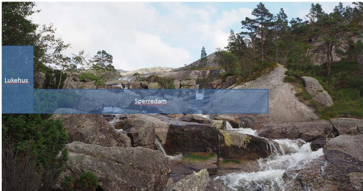
Figur 3 Skisse av sperredam og deler av lukehus.

Alle tekniske installasjoner utformes nærmere i detaljfasen, men det vil bli vektlagt å gi utforming som gjør inngrepene minst mulig synlige. Dette kan omfatte bruk av farget betong, bruk av naturstein og ved utforming og plassering av dam og lukehus.