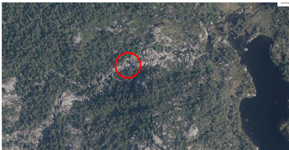
Figur 1 Rød ring viser mulig plassering for alternativt inntak, om lag kote 435

Inntaket ligger om lag 200m nedstrøms inntaksplasseringen ved Bremstølsvatnet.