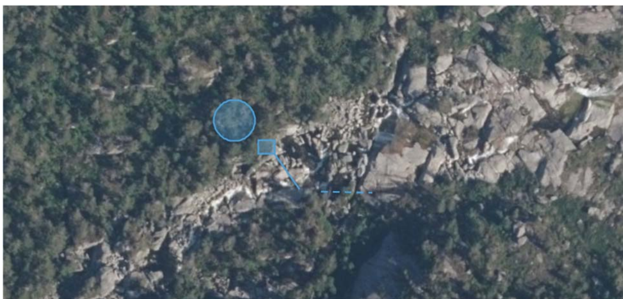
Figur 2 Streken viser plassering av sperredam og ringen viser mulig plassering riggområde. Firkanten viser lukehuset. Den stiplede linja viser en terskel for å lede vann mot inntaket.