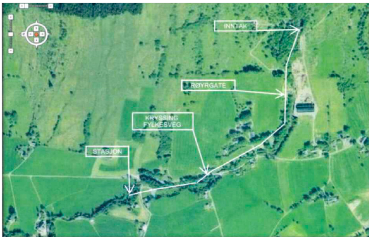
Figur 2 Biletet viser Tveitelva og planlagt utbyggingsområde for Auno minikraftverk

Det er er i dag to små elvekraftverk i Tveitelva ovanfor det planlagde minikraftverket. Tveitelva Kraft AS har ein årsproduksjon på omlag 0,7 GWh; Ilaget Energi AS har ein installert effekt på 1,7 MW og ein årsproduksjon på om lag 7,88 GWh. Begge desse kraftverka er eigde og drivne av to av fallrettseigarane i det planlagte nye prosjektet.